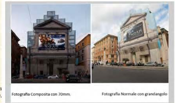
Esepio di fotografia normale e composita.

Attraverso la comprensione e l'analisi di questa particolare tecnica e le sue fasi principali.