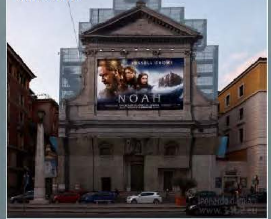
"Noah" Composite image Roma 2014

... Con le possibilità offerte dalle tecniche informatiche, si arriva oggi a poter realizzare immagini di Fotografia Composita che hanno "virtualmente" la possibilità di rappresentare la realtà proiettata all'interno di una sfera.