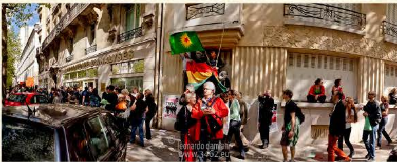
"Primomaggio" Paris, France

Sebbene possa essere applicata idealmente a qualsiasi soggetto fotografico, la F. C. trova la sua applicazione più utile nella fotografia di Architettura (interno ed esterno) e di paesaggio, siano esse concepite a livello amatoriale che professionale. Sono questi i fotografi che trovano beneficio nella conoscenza e nell'utilizzo di questa tecnica.