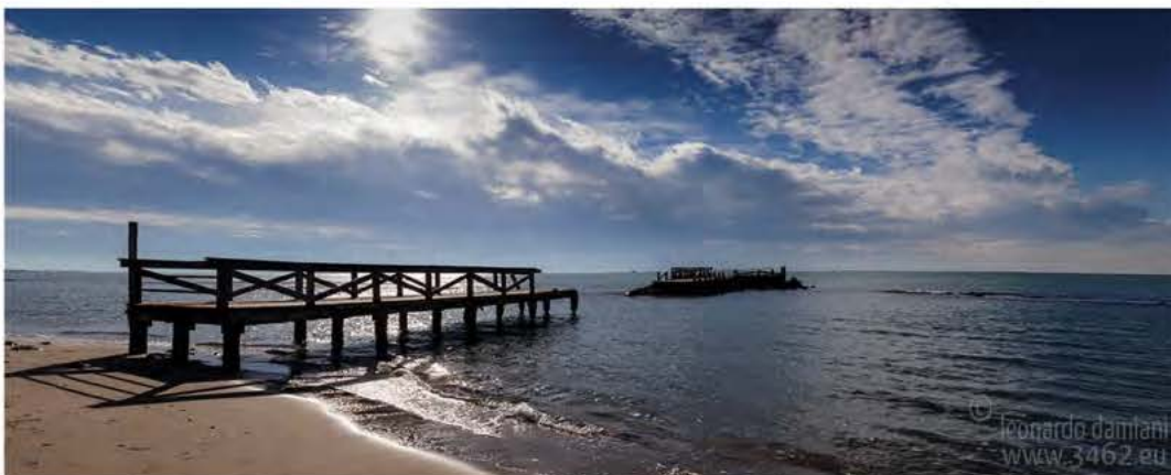
"Vecchio Pontile" Lido Di Ostia, Roma

E' una tecnica utile sia per usi commerciali che per usi più "creativi".